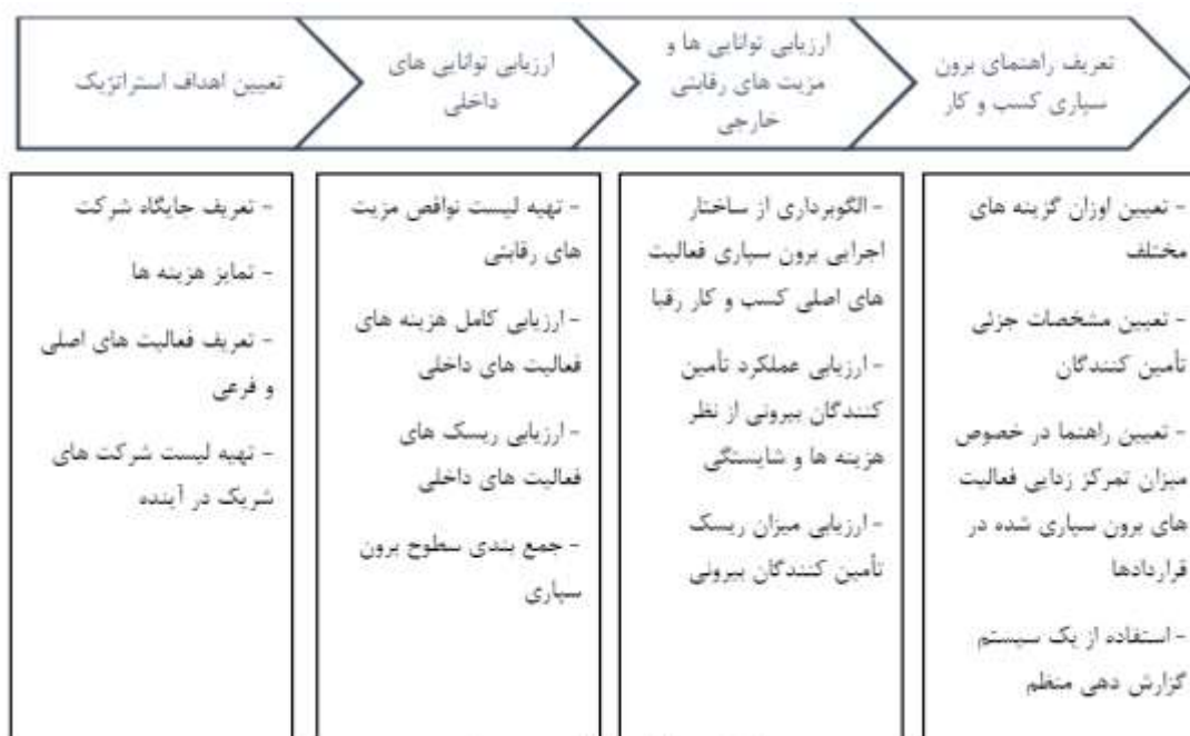
شکل ۱: روند کلی برون سپاری [۲۵]

در قراردادهای برون سپاری پیچیده که در سطح سازمان تنظیم می شود، دستیابی به سطح کلی توافق مهم است. برای موفقیت مدیران ارشد در این قراردادها، ترسیم چارچوب کلی برون سپاری مفید خواهد بود. رعایت اصول کلی قراردادها منجر به صرفه جویی در هزینه ی تراکنش ها مانند هزینه انجام مذاکرات و توافقات قراردادی، انتخاب و ارزیابی تأمین کننده و دستیابی به شایستگی رقابتی می شود. شکل (۱)، چهارچوب کلی فرآیند برون سپاری را نشان می دهد [۲۵].