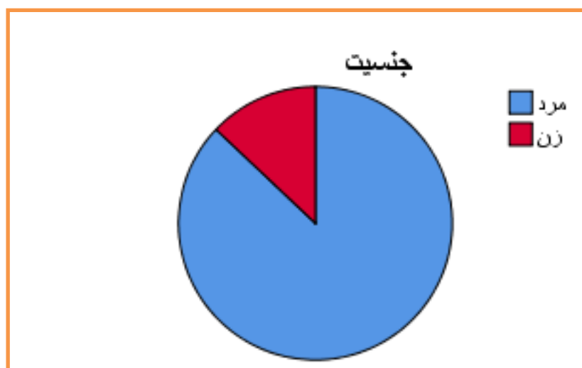
نمودار ۴-۱ فراوانی پاسخ دهندگان بر حسب جنسیت