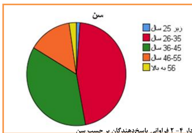
نمودار ۴-۲ فراوانی پاسخ دهندگان بر حسب سن